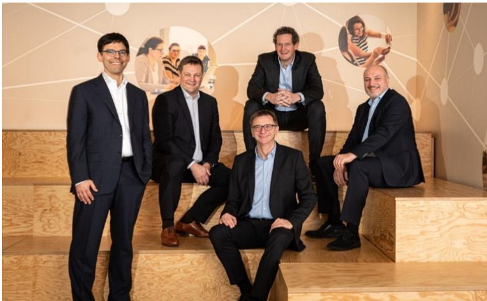
Junta directiva del Grupo Mercateo.